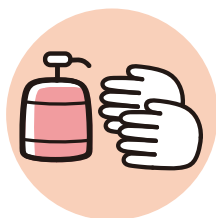
手洗い消毒の徹底