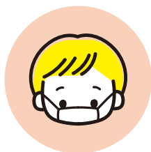
スタッフのマスク着用