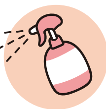
お客様に触れる道具や スペースの消毒の徹底

その他、政府で発表されている感染拡大対策に基づき、 安心・安全にご来店いただけるよう努めて参ります。