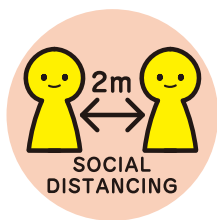
ご来店・ご予約の人数制限及び ソーシャルディスタンスの確保